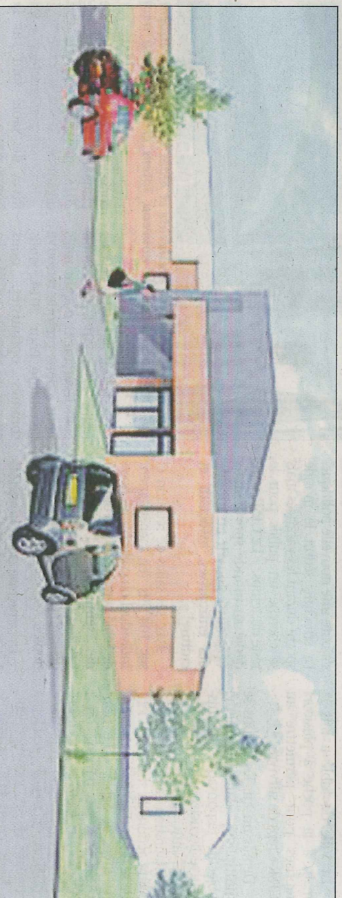
Voilà à quoi ressemblera le nouveau dojo, à Rémy-Lambert. Ce sera en juin 2015.

pour les arbitres, ainsi que deux bureaux, des locaux de rangement et une infirmerie. À l'extérieur, se trouvera un parking de 45 places. Idéal pour accueillir les familles et les pratiquants contrairement à aujourd'hui. Accueillir des compétitions. Voilà quelque chose que les